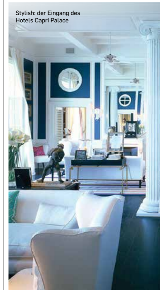
Stylish: der Eingang des Hotels Capri Palace